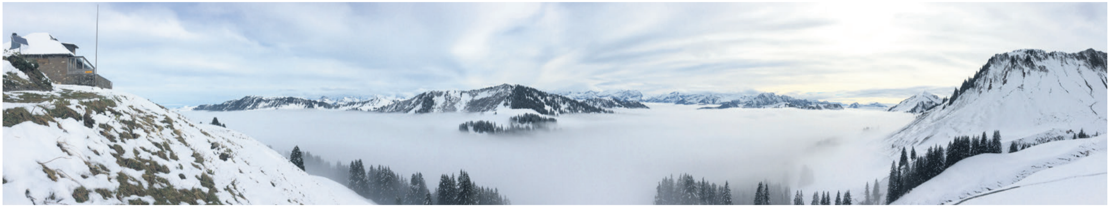
Die Grubenberghütte ist der Rückgrat vom SAC Oldenhorn. Dank ihr können die Mitgliederbeiträge tief gehalten werden, obwohl ein attraktives Jahresprogramm angeboten wird.