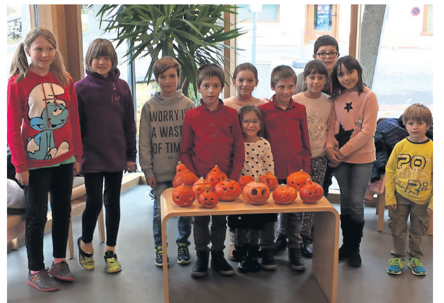
Die Kinder schnitzten am Herbstfest der römisch-katholischen Kirche Kürbisse.